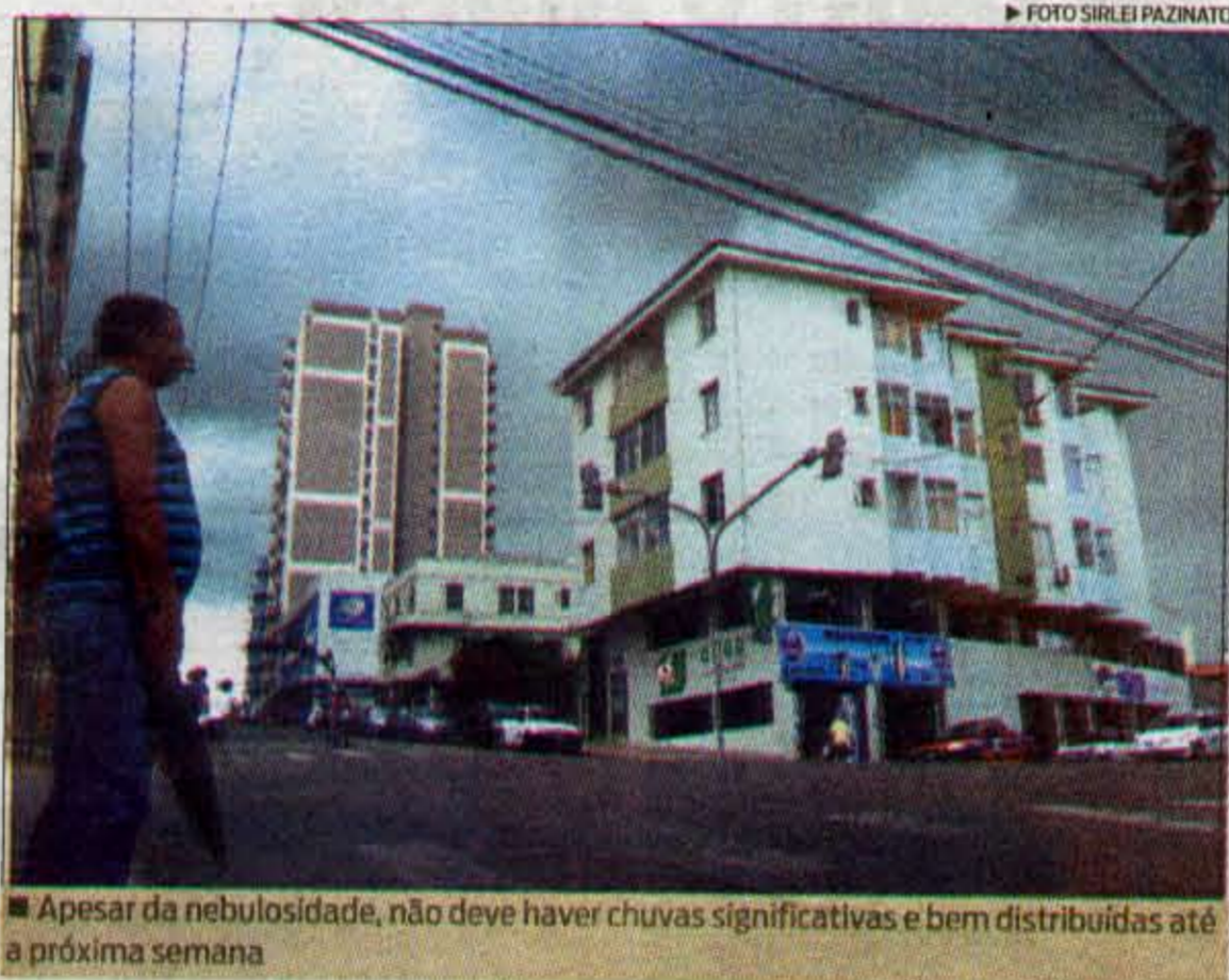
Apesar da nebulosidade, não deve haver chuvas significativas e bem distribuídas até a próxima semana