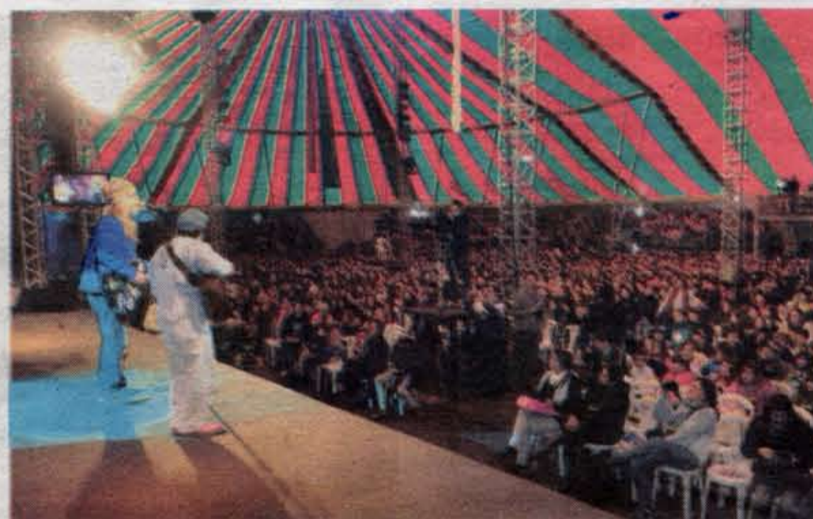
Jornada será realizada em agosto