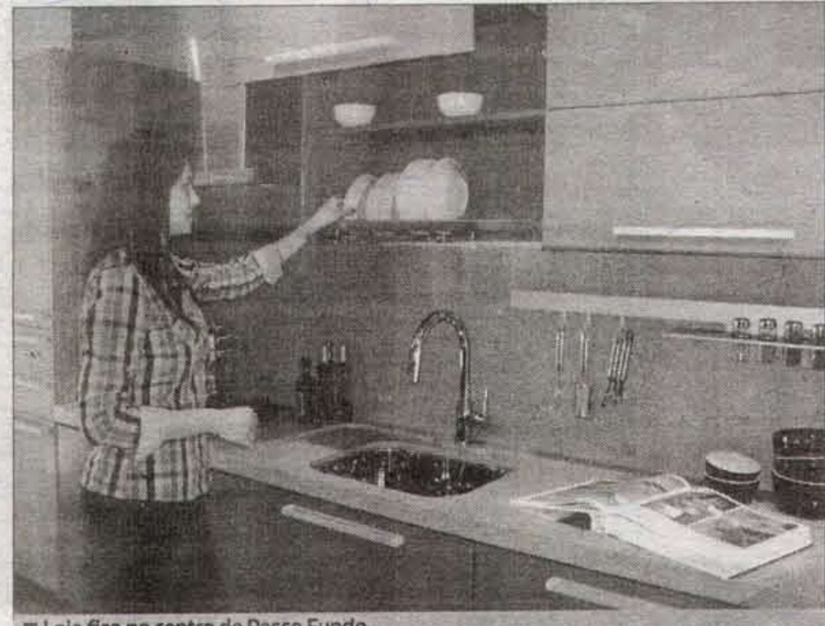
Loja fica no centro de Passo Fundo