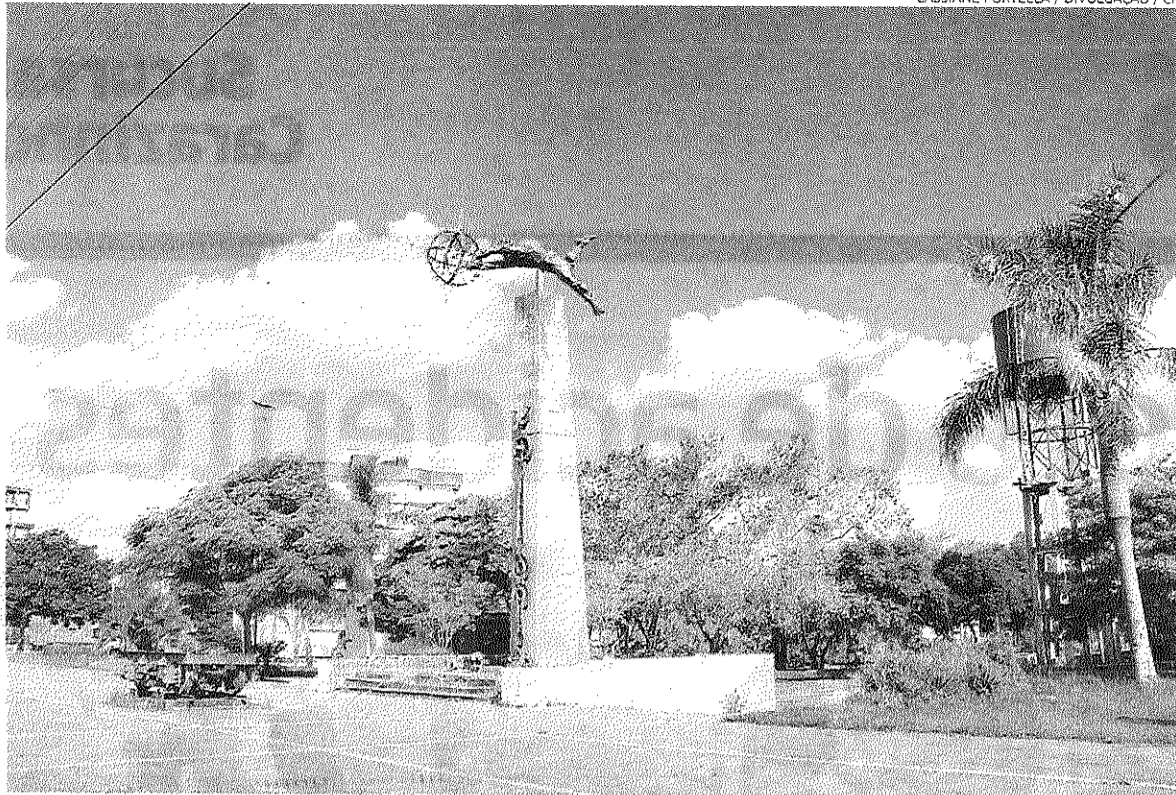
Revitalização do parque deverá incluir mudanças na iluminação, acessibilidade e segurança, entre outros pontos