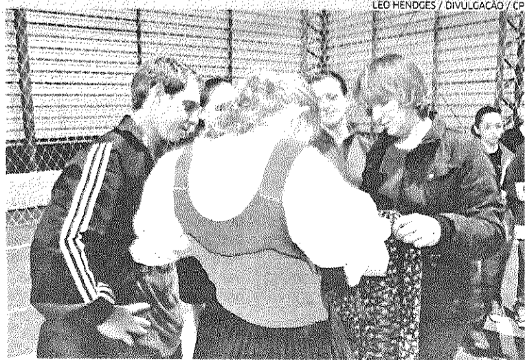
Novos trajes serão apresentados no dia 18 deste mês