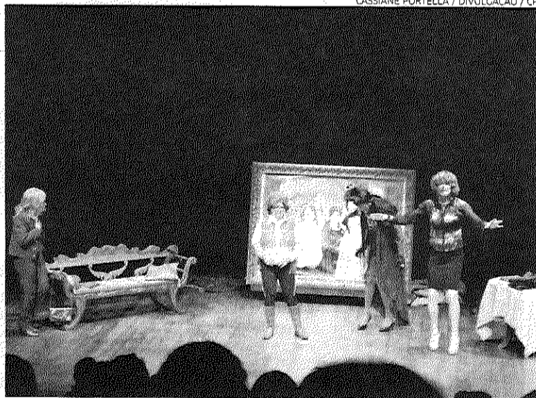
Peça 'As Filhas da Mãe' abriu a programação da mostra

O prefeito também lembrou que na próxima segunda-feira haverá a assinatura de autorização da reforma do Teatro Municipal Múcio de Castro, em um ato que acontecerá em seu gabinete. "Esta reforma é uma conquista para Passo Fundo que, após tantos anos de espera, contará com o investimento de mais de R$ 800 mil para a melhoria do espaço", disse. A programação da 1ª Mostra Passo Fundo em Cena segue até o dia 12 de agosto.