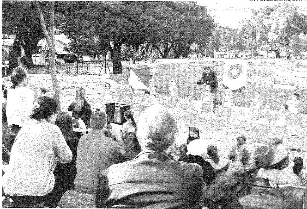
Atividade integra a comunidade com apresentações artísticas diversas