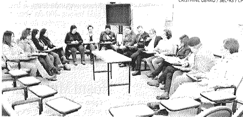
Dirigentes da SEC receberam a direção do Cpers ontem, na Capital

Por sua vez, o governo alega que propôs constituir uma mesa de negociações para discutir a pauta, ponto por ponto, e as expectativas do sindicato.