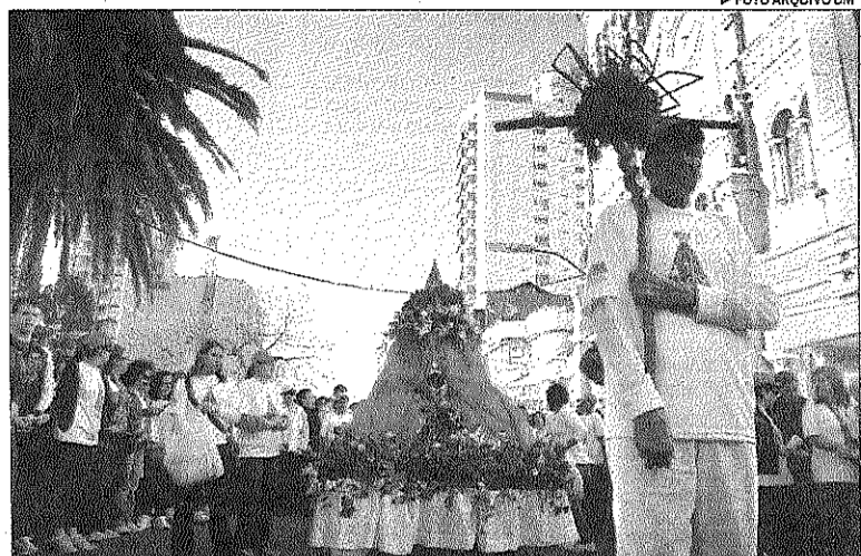
Todos os anos milhares de fiéis acompanham a imagem da Santa em procissão