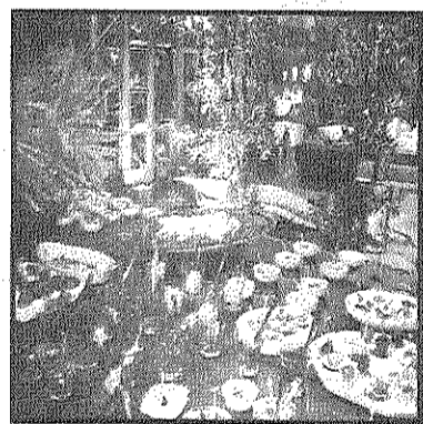
Pasta e Riso com Camila Barquette Pissetti