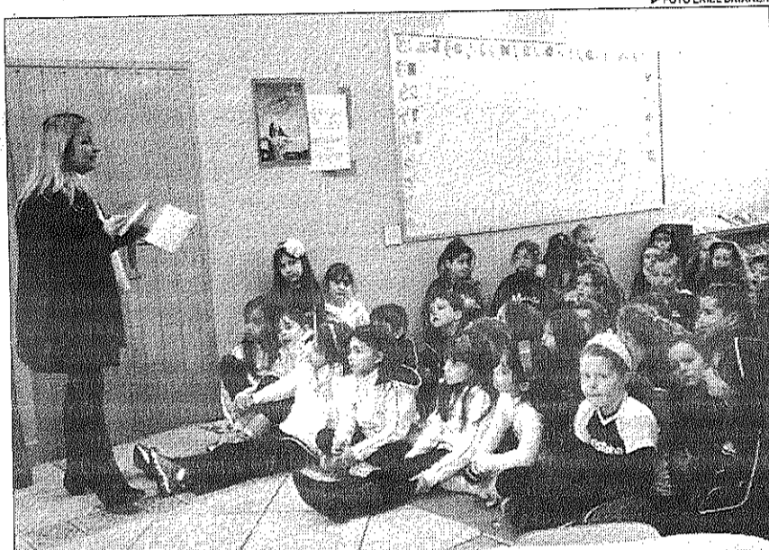
Alunos do Colégio Marista Conceição participam das atividades da Pré-Jornadinha

A Pré-Jornadinha constitui-se na leitura de uma ou mais obras dos autores que estarão presentes na 7ª Jornadinha Nacional de Literatura, no período de 27 a 31 de agosto. É o momento em que os estudantes do ensino fundamental, com a mediação dos professores, são incentivados a conhecer previamente os escritores e seus respectivos livros, bem como desenvolver discussões. Escolas de toda a região estão realizando ações.