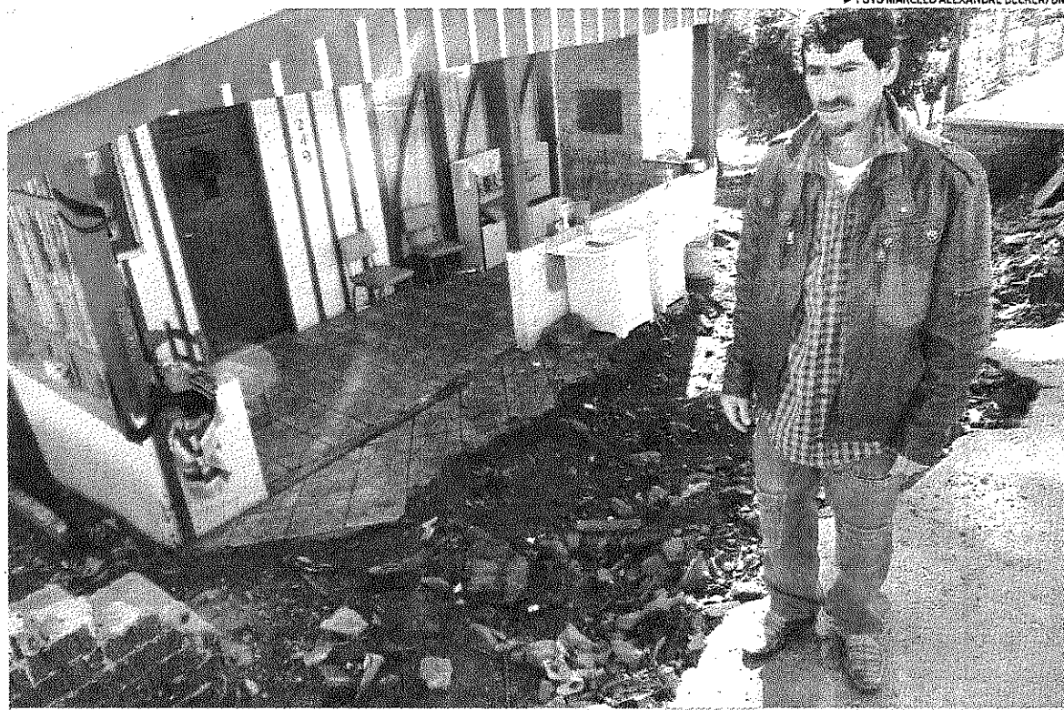
Problema segue desde dezembro. Secretário afirma que em até 15 dias trabalhos de reparo devem ter início