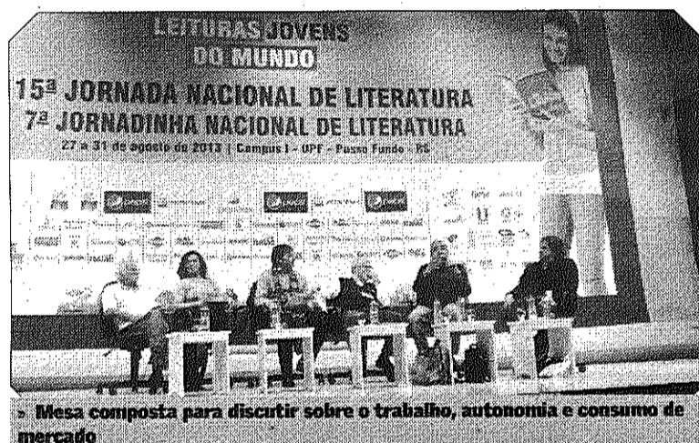
► Mesa composta para discutir sobre o trabalho, autonomia e consumo de mercado

nove filhos. “Descobri que eu era o único que sabia escrever bonito e por isso era respeitado pela família. O meu gosto pela leitura salvou a minha família. Ao mesmo tempo, a questão era qual é a função da poesia, da escrita, diante de um mercado feroz”. Aos poucos cada escritor falou sobre suas crenças e visão do mercado atual, como o escritor Roberto DaMatta que destacou no consumo o poder dos jovens: “Os jovens de hoje têm muito mais do que tiveram seus pais ou avós. Eles têm autonomia do consumo