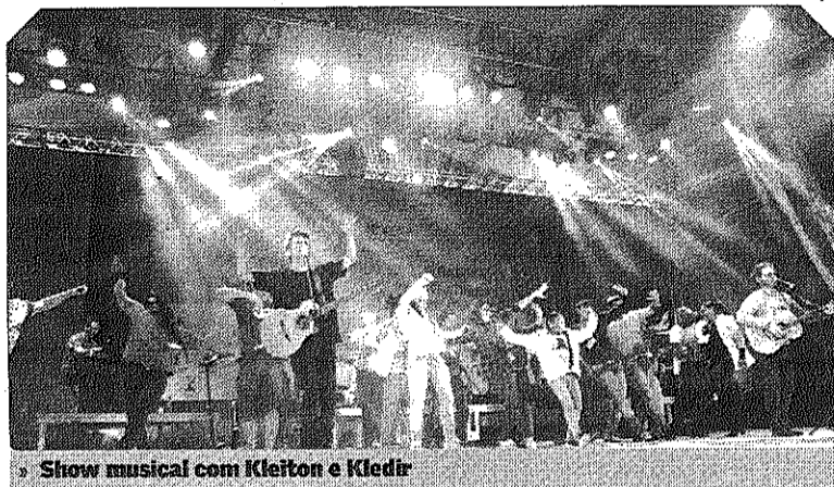
► Show musical com Kleiton e Kledir