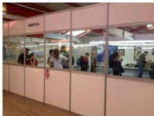
Iniciativas da área de tecnologia expostas na Jornada

Os mais de 28 mil inscritos na edição de 2013 da Jornada Nacional de Literatura encontraram mais do que livros e autores pelos corredores da movimentação cultural. O trabalho Marista desenvolvido na área da tecnologia também marca presença, com projetos dos Colégios e das Unidades Sociais da Rede. As iniciativas estão expostas de 27 a 31/8, no Portal das Linguagens, no campus da Universidade de Passo Fundo (UPF).