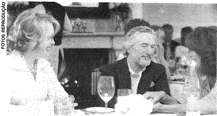
Diane Keaton, Robert De Niro e Susan Sarandon em cena do filme.