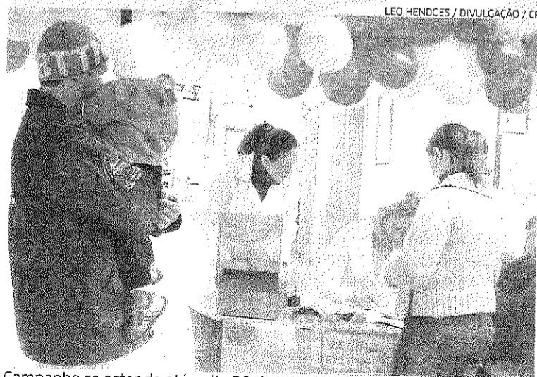
Campanha se estende até o dia 30 deste mês