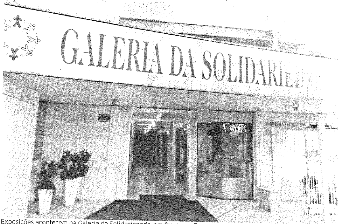
Exposições acontecem na Galeria da Solidariedade, em frente ao Eenav

P asso Fundo – É nos princípios da Economia Popular Solidária que uma série de grupos comunitários se organiza para gerar e agregar renda às suas famílias. Com base associativista e cooperativista, a economia solidária é uma alternativa econômica fundada em relações de colaboração, sustentabilidade e protagonismo. A Cáritas, que acredita neste modelo como forma justa de produção, meio de autonomia do sujeito e caminho para a inclusão social, aposta na organização e no acompanhamento destes grupos também como sinal de luta contra a exploração e acumulação privada de riqueza, que gera desigualdades. Nesse sentido, a entidade fomenta a consolidação de iniciativas que promovam justamente esta economia, a fim de defender um modo de produção sustentável e inclusivo. Atualmente, são cerca de 60 grupos acompanhados pela Cáritas em 12 municípios da região Norte do Estado