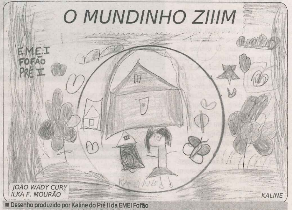
Desenho produzido por Kaline do Pré II da EMEI Fofão