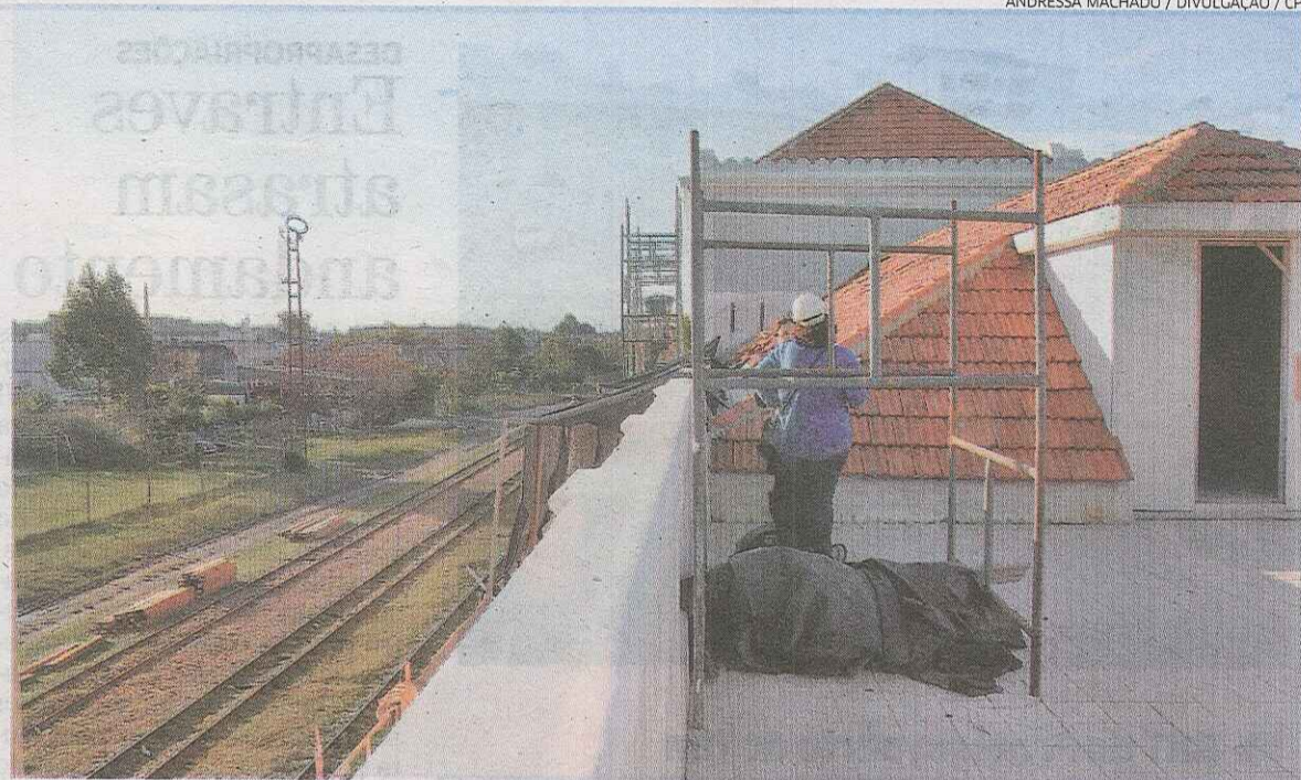
Obras no prédio datado de 1884, em Pelotas, serão concluídas em julho para o local abrigar serviços à população