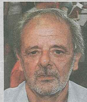
TABEU VILANI, BD

Natural de Alegrete, Sergio Faraco é um dos escritores mais premiados do Rio Grande do Sul. Estudou na então União Soviética, nos anos 60, e, no Brasil, bacharelou-se em Direito. Recebeu por três vezes o Prêmio Açorianos de Literatura, e, em 1999, o Prêmio Nacional de Ficção da Academia Brasileira de Letras. Seus contos foram publicados em vários países.