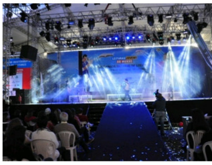
Jornada estava marcada para o final de setembro deste ano