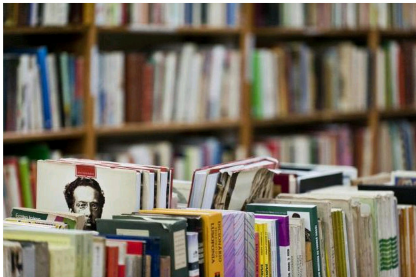
16ª edição da Jornada Nacional de Literatura de Passo Fundo foi cancelada