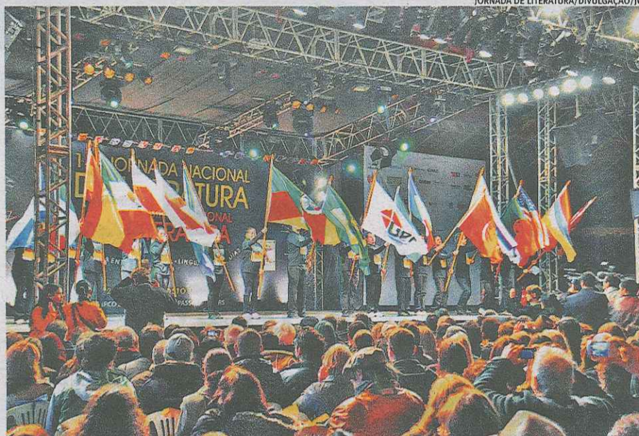
JORNADA DE LITERATURA/DIVULGAÇÃO/JC

Uma triste notícia para a cultura brasileira. A Universidade de Passo Fundo confirmou, ontem à tarde, o cancelamento da