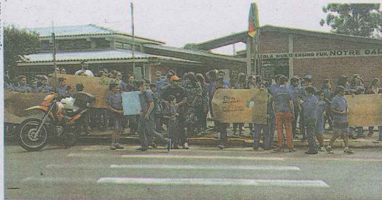
■ Escola realizou protesto na semana passada

■ Reunião entre representantes da Prefeitura de Passo Fundo e da direção da escola acontece hoje (08)