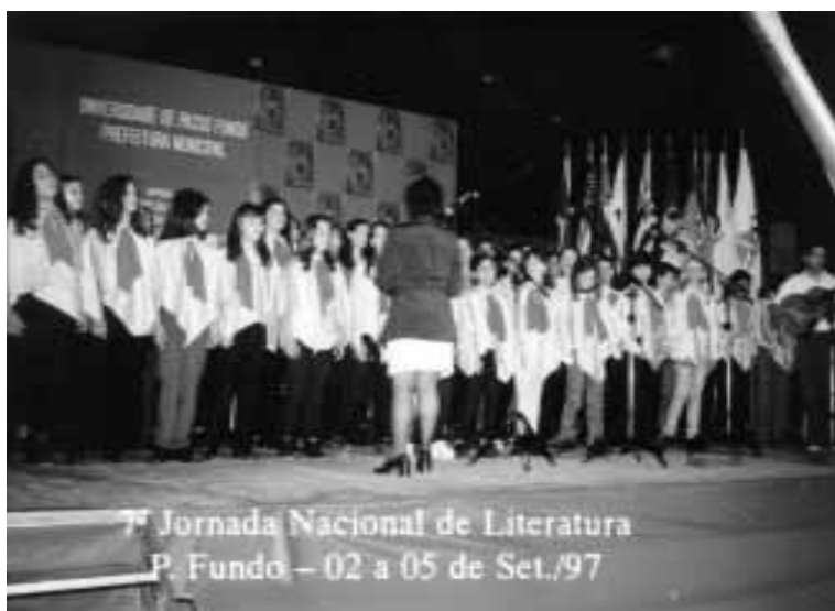
Coral Municipal Passo Fundo