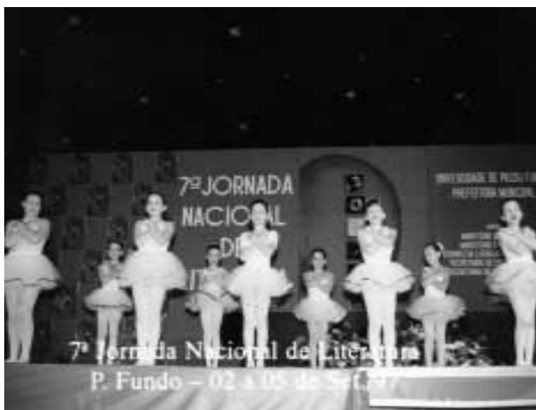
Ballet de Câmara de Passo Fundo