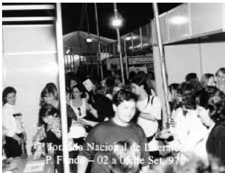
Feira do Livro