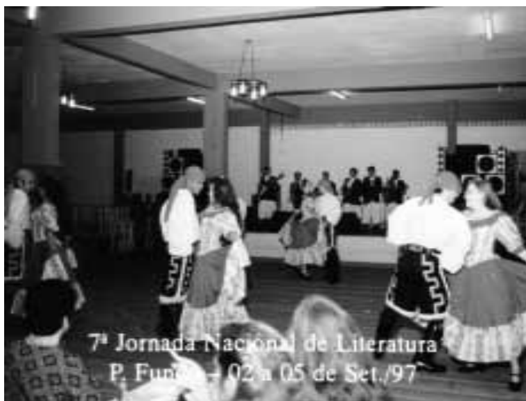
Tebanos de Igaí de Passo Fundo