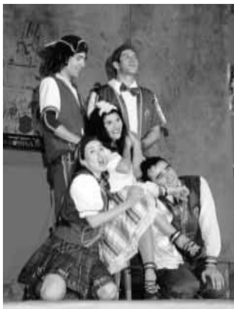
Peça teatral Uma professorinha muito maluquinha (Porto Alegre).