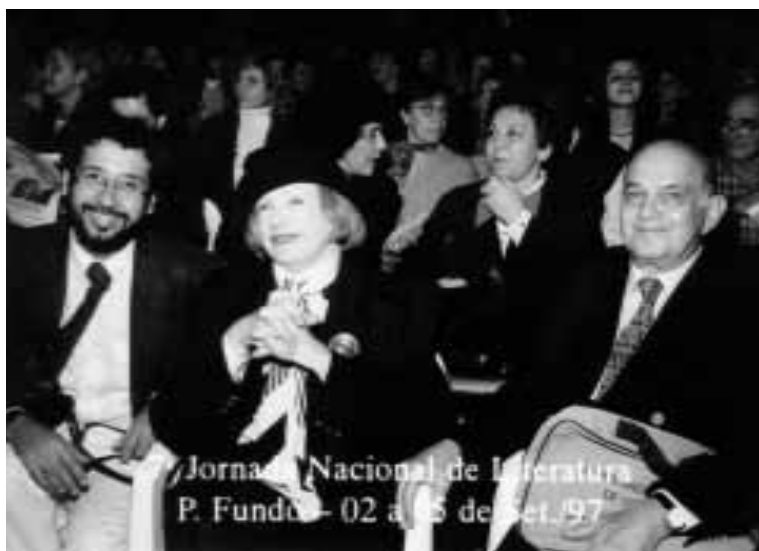
Escritores entre o público