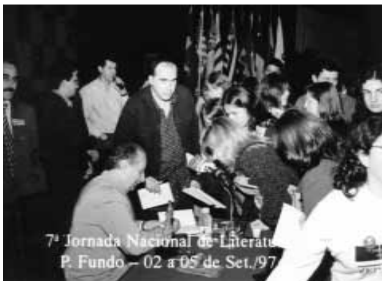
Carlos Heitor Cony