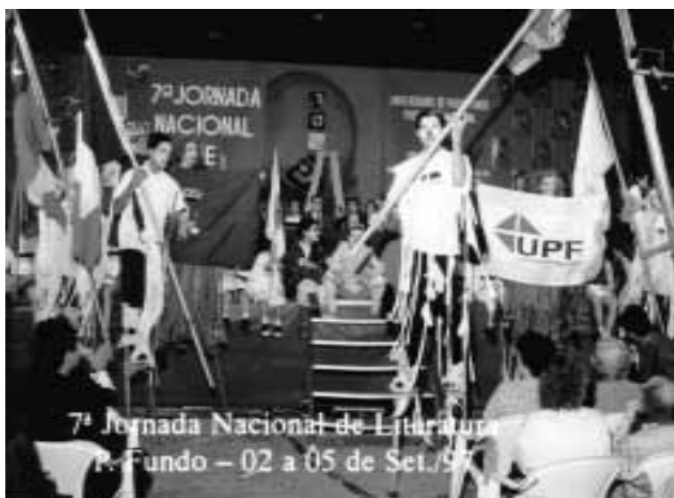
Grupo de Teatro da UPF