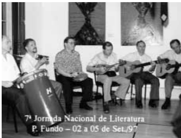
Banda de Chorinho (Carazinho)