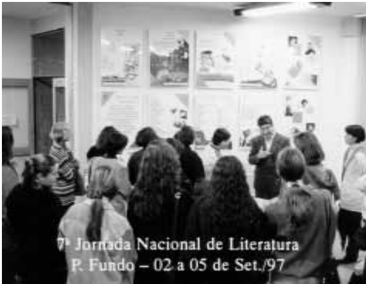
Mostra "Poesia e visibilidade (Fundação Cultural Itaú)