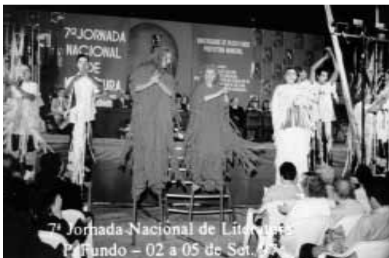
Sessão de abertura