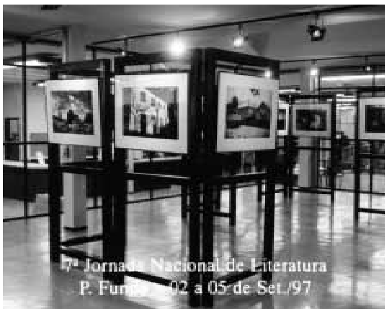
Exposição Rio Grande do Sul: Cenas e Paisagens