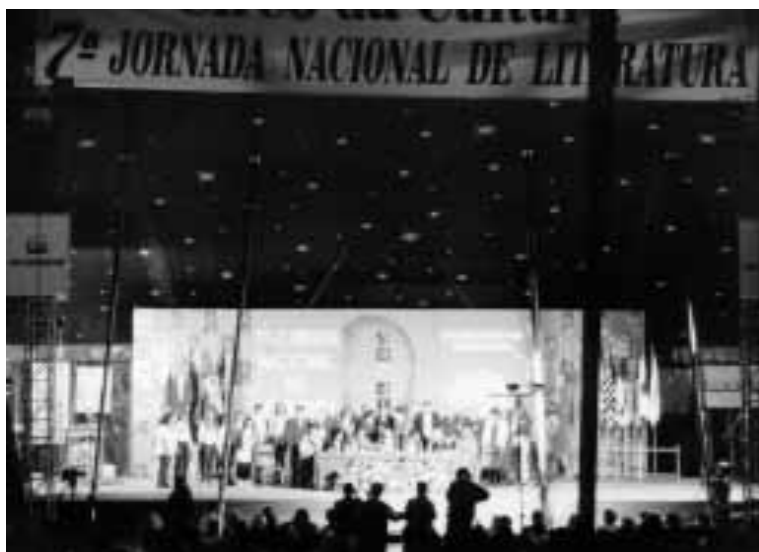
Circo da Cultura