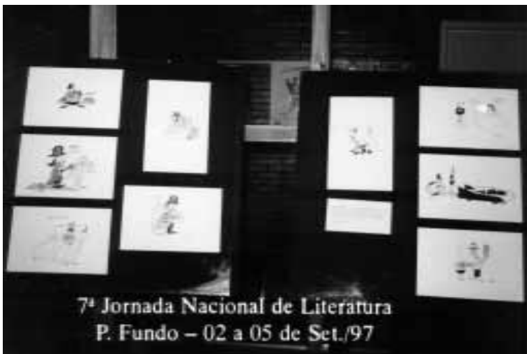
Obras de chargistas e cartunistas gaúchos