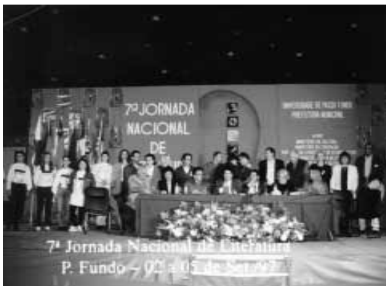
Sessão de encerramento