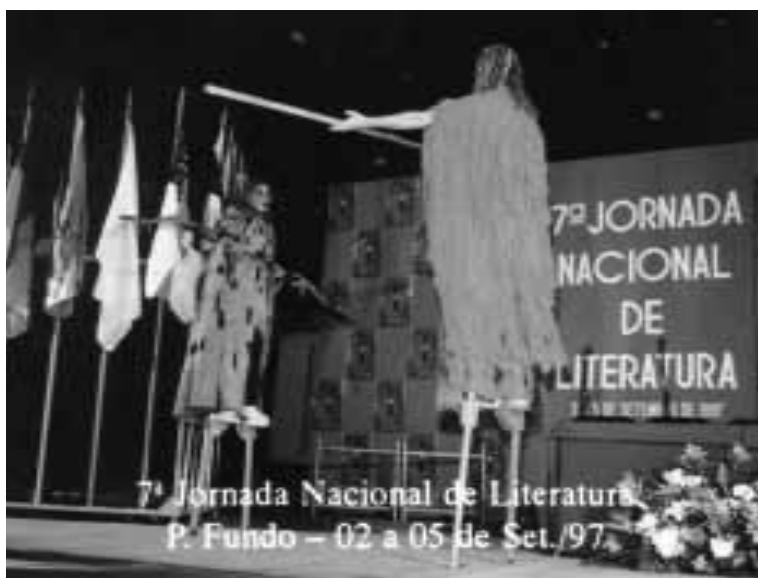
Perfôrmance final do Grupo de Teatro da UPF