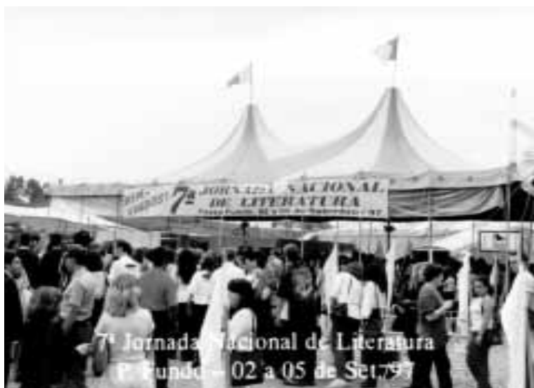
Acesso ao Circo da Cultura