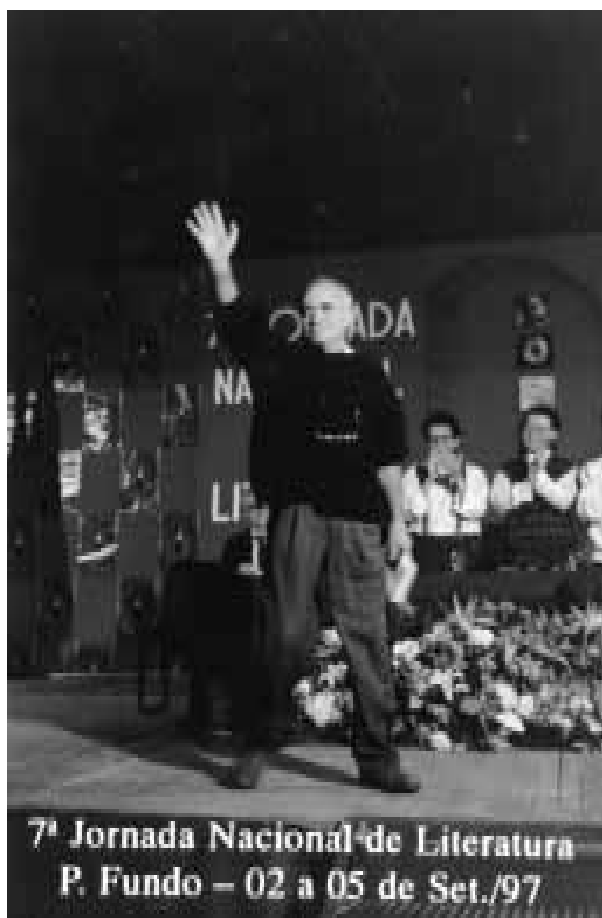
Ignácio de Loyola Brandão