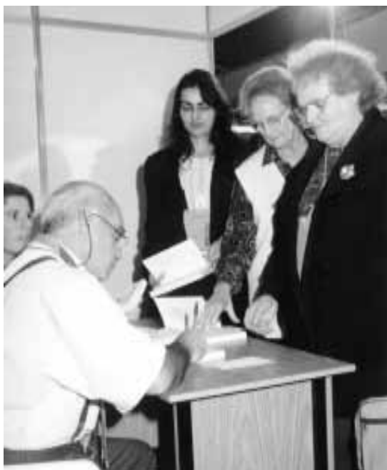
Ignácio de Loyola Brandão