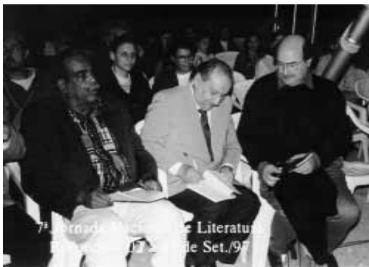
Escritores entre o público