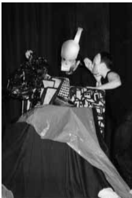
Espetáculo de bonequeiros